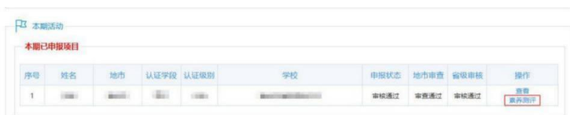
素养测评-本期已申报项目

2026年度统一要求在当前活动页面“本期已申报项目”处，找到申报信息操作列的「素养测评」按钮，点击进入参与。