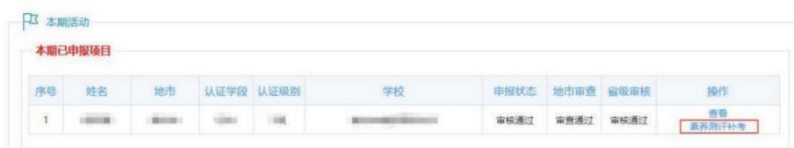
素養測評（補考）-本期已申報項目

在當前活動頁面“本期已申報項目”處，找到申報信息操作列的「素養測評補考」按鈕，點擊進入參與。